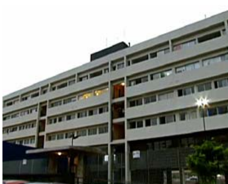
Residencial Jardim Edith